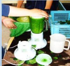
刈り取った藍を葉と茎に分ける作業。素早く作業します。ミキサーにかけて液を作る。