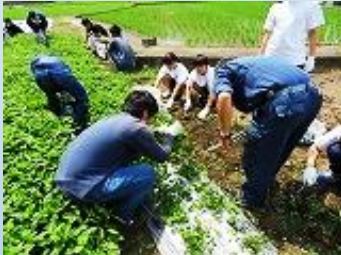
勝浦校の農場で順調に育った藍草抜きと平行して、藍を刈り取ります。