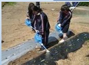
藍を傷つけないように、丁寧に水をやります。