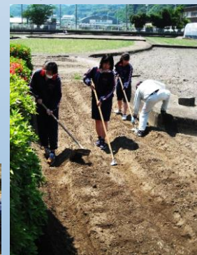
畝立て 初体験です。