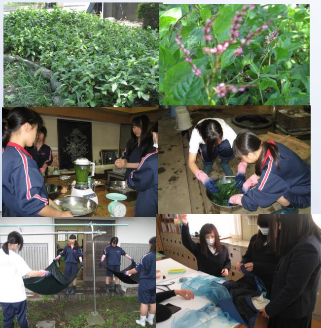
松西花壇の刈り取り、生葉染め、製作、ファッションショー